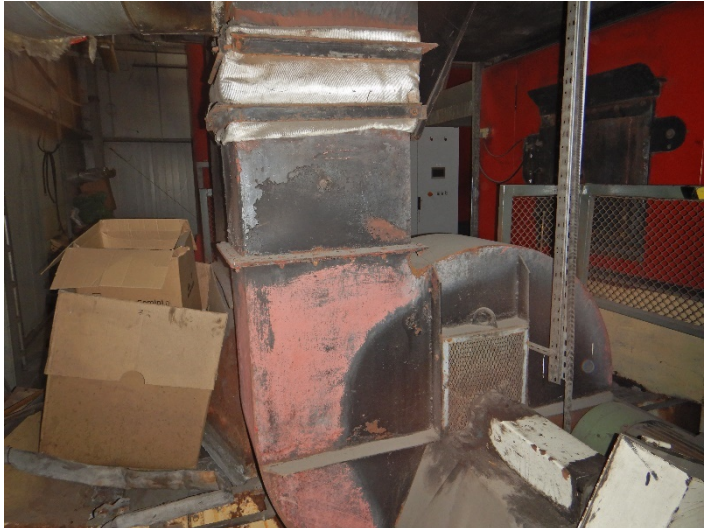
Fot. 5 Widok wentylatora do modernizacji