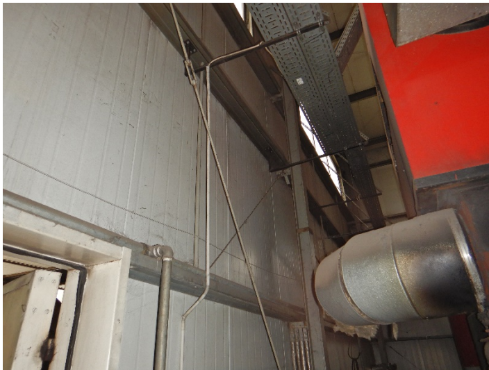
Fot. 6 Widok czopucha kotła do modernizacji