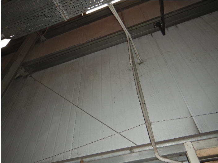
Fot. 7 Widok fragmentu ściany z płyty warstwowej do demontażu i odtworzenia w celu wystawienia oraz wstawienia nowego urządzenia