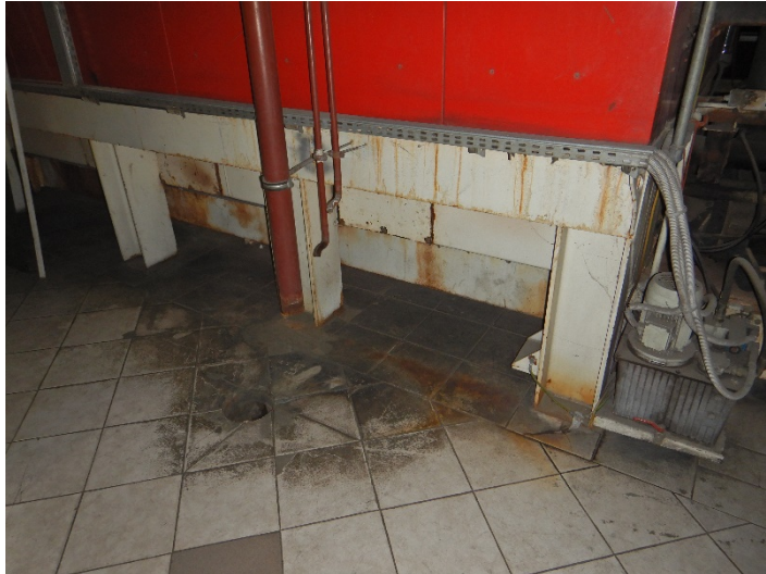
Fot. 3 Widok posadowienia kotła do modernizacji