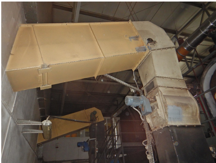
Fot. 9 Widok systemu dostarczania paliwa do modernizowanego kotła