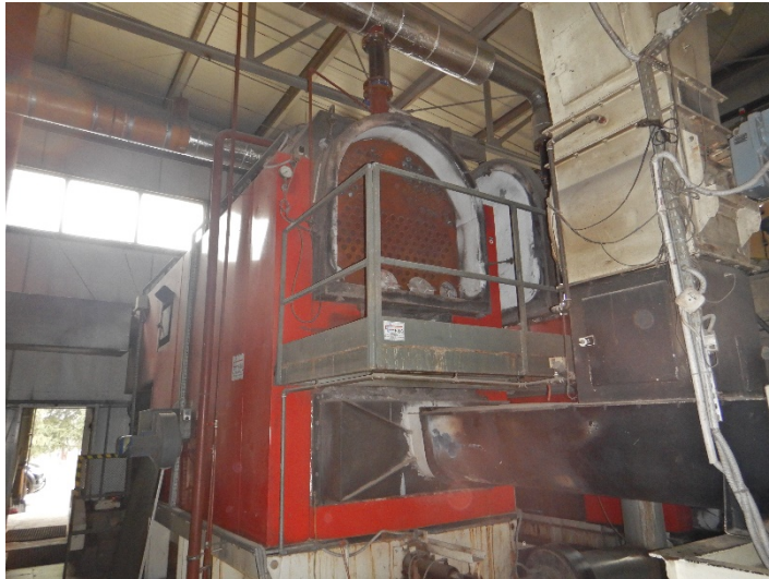
Fot. 1 Widok kotła do modernizacji