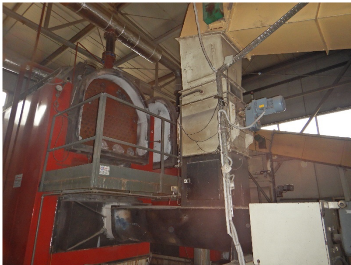
Fot. 2 Widok kotła do modernizacji