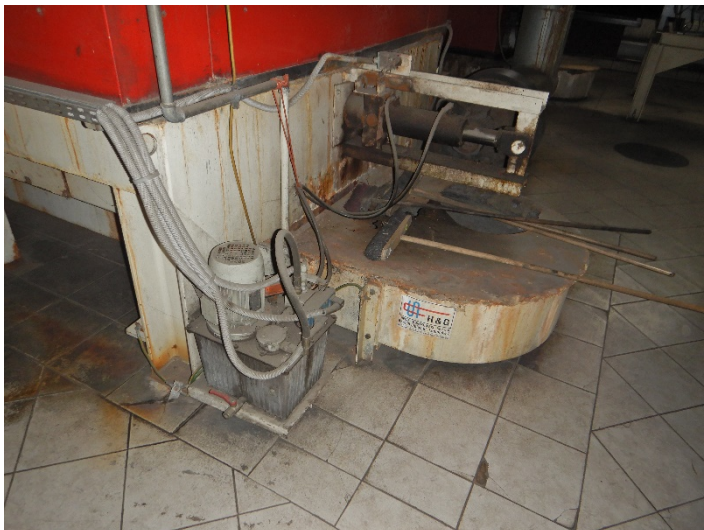
Fot. 4 Widok posadowienia kotła do modernizacji