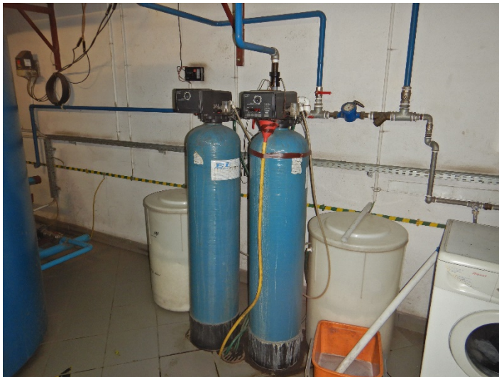
Fot. 8 Widok stacji uzdatniania wody do regeneracji złoża